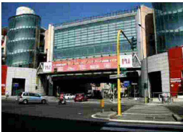
fiera milano city

Mam , Mostra a Milano Arte e Antiquariato, sarà ospitata da fieramilanocity dal 28 gennaio al 5 febbraio